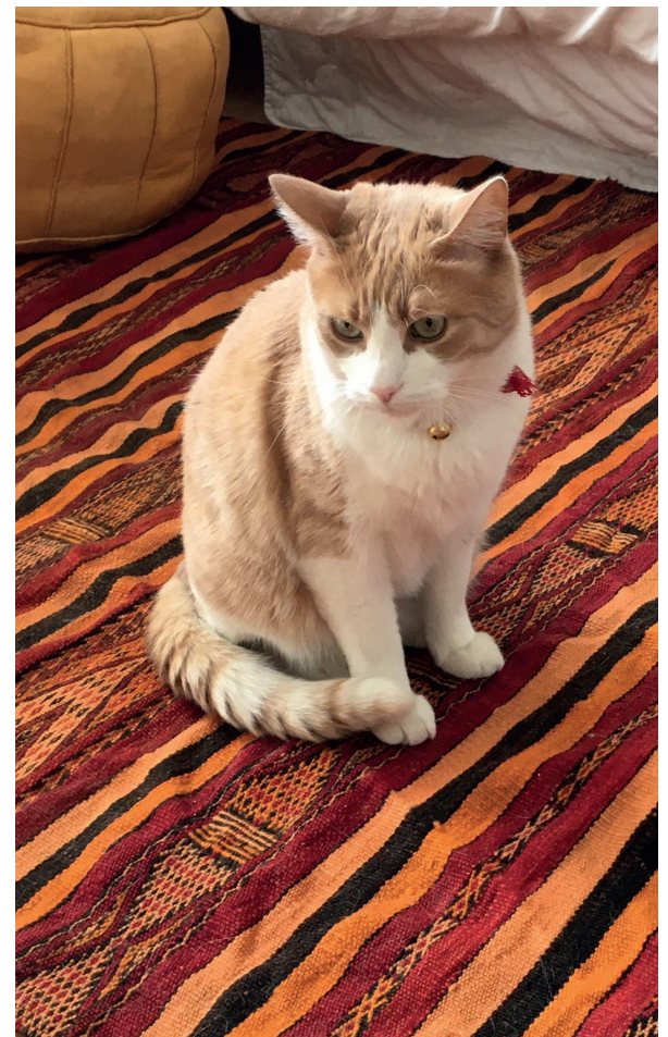
Sonbul, der Herbergskater.

Einer Frau mit drei Kindern ist es (trotz Corona-Krise) gelungen, eine eigene Wohnung zu finden, was den anderen Frauen Hoffnung gibt, bald selbst ein festes Zuhause zu haben.