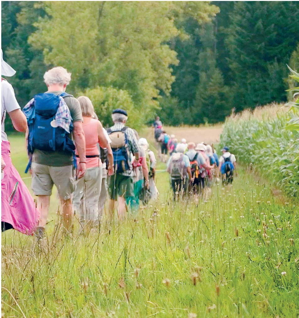
er nde unterwegs.