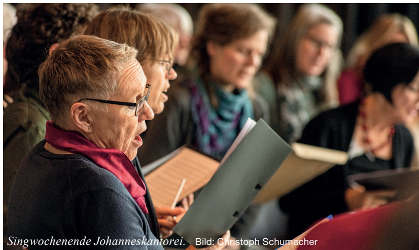
Singwochenende Johanneskantorei.