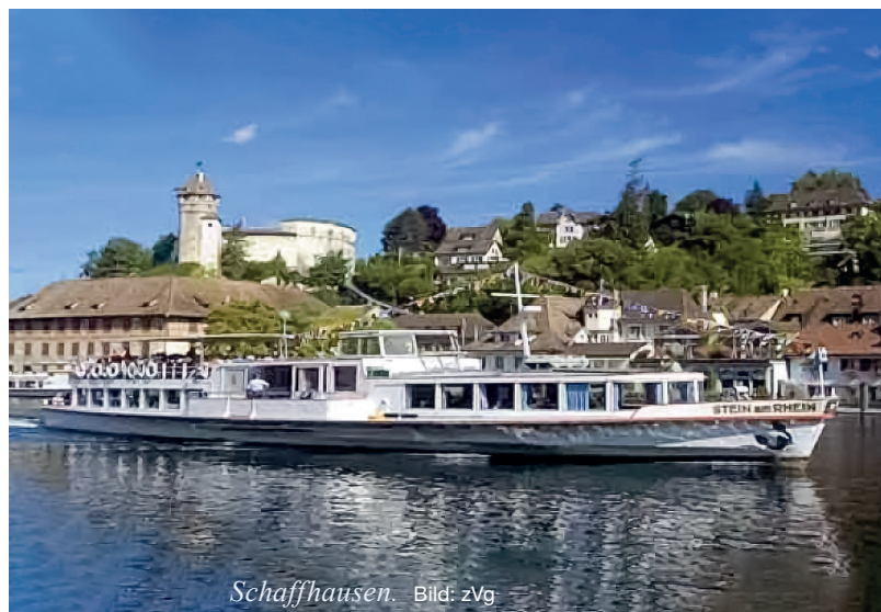
Schaffhausen.