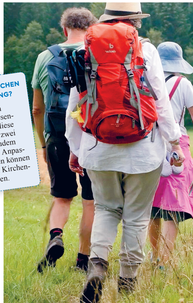
Eine Pilgerreise bietet viel Raum und Zeit für Reflexion: Pilger ne

Beim Pilgern gerät der innere Mensch in Bewegung und schöpft Kraft. Das Pilgerzentrum St. Jakob in Zürich leistet dabei seit 25 Jahren Unterstützung.