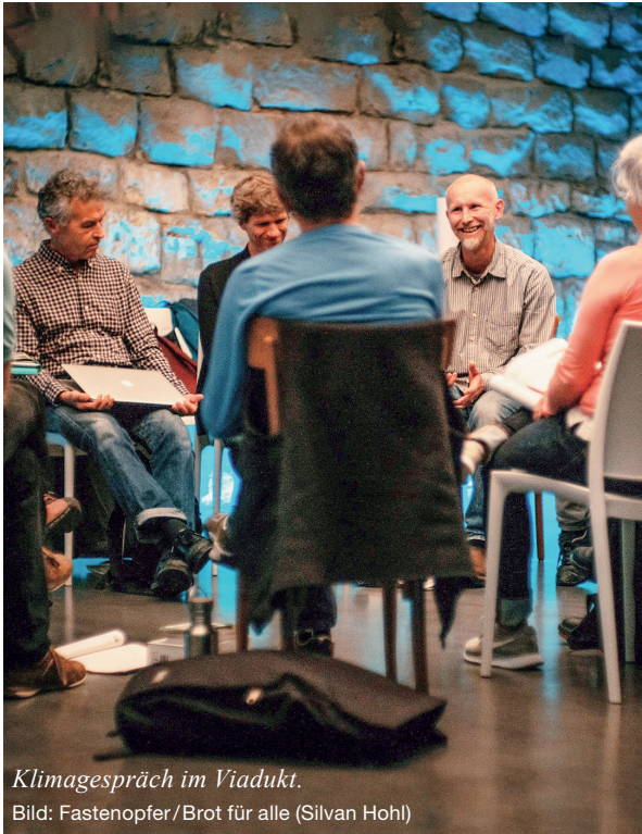
Klimagespräch im Viadukt.