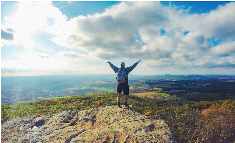
Freiheit auf dem Berggipfel.

Beim Träumen wird einem vielleicht auch bewusst, was die Freiheit einschränkt oder sie raubt: Altlasten, Druck, Angst und Sorgen. Fragen tauchen auf: Wie frei bin ich denn? Wie frei kann und möchte ich sein? Was gibt mir Freiheit? Was schränkt sie ein? Und überhaupt: Was ist Freiheit?