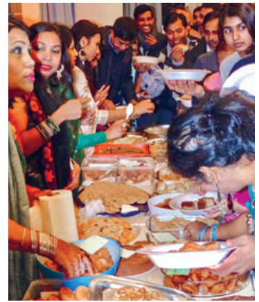
Süssigkeitenfest im Kirchgemeindehaus Johannes.