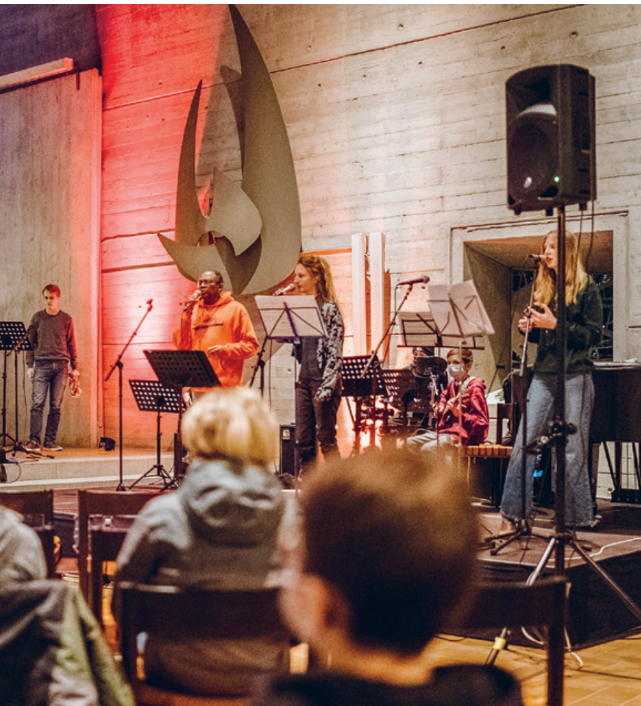
den Wünsche im Zentrum.