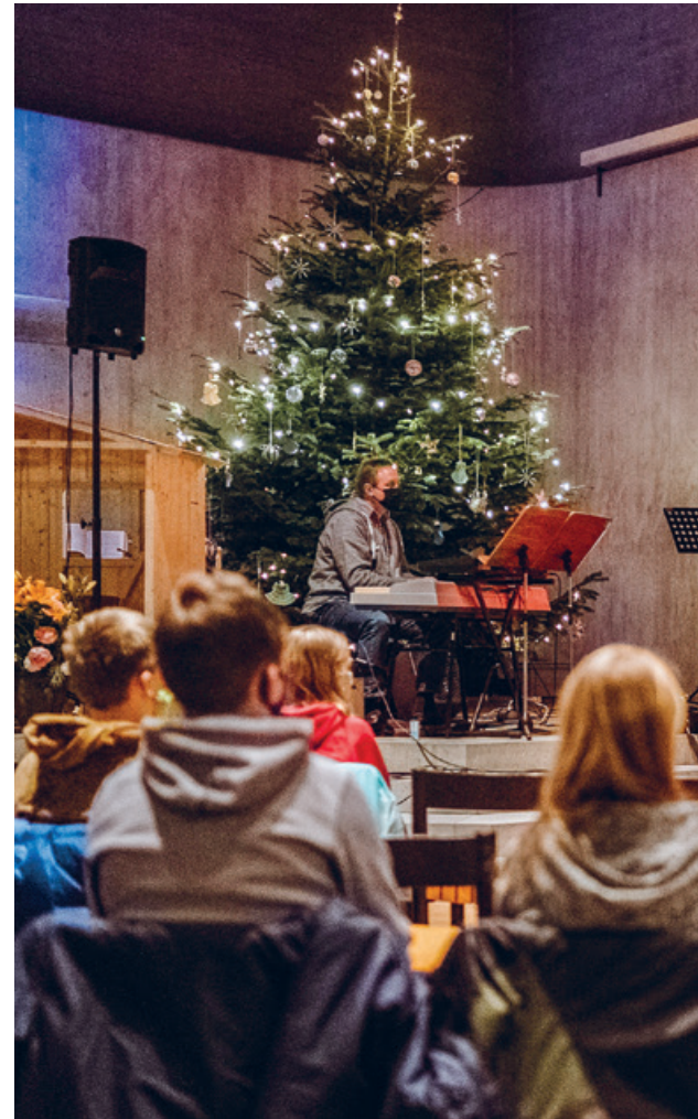
Am Jugendgottesdienst «Taste it» in der Kirche Leimbach stan

Die Kreativität von Kindern und Jugendlichen ist grenzenlos, wenn es um Wünsche geht. Gut rechnen und schreiben können; dass es dem Kollegen im Spital schnell wieder besser geht oder doch ein Tram, das fliegen kann?