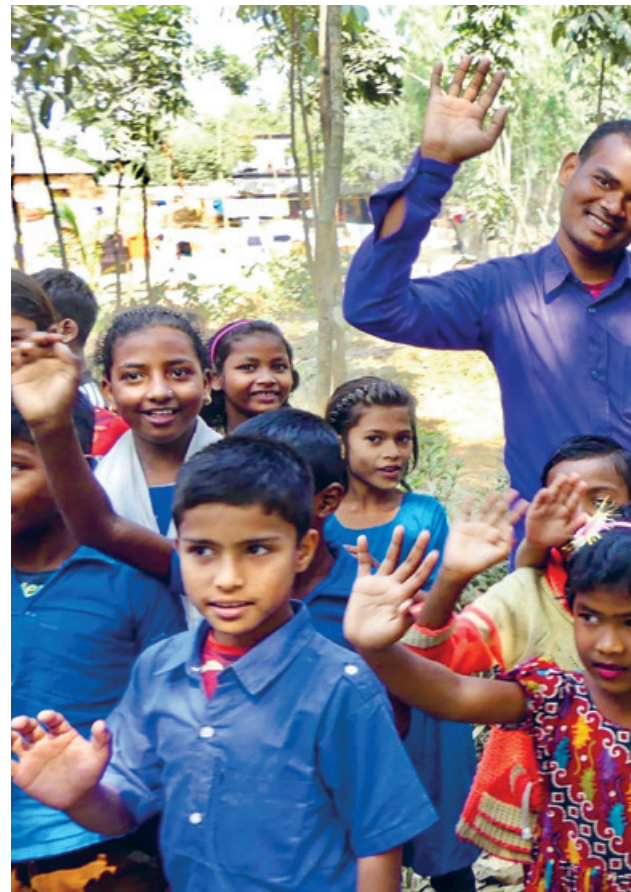
Herzlicher Abschied beim Projektbesuch 2020 in der Swarup