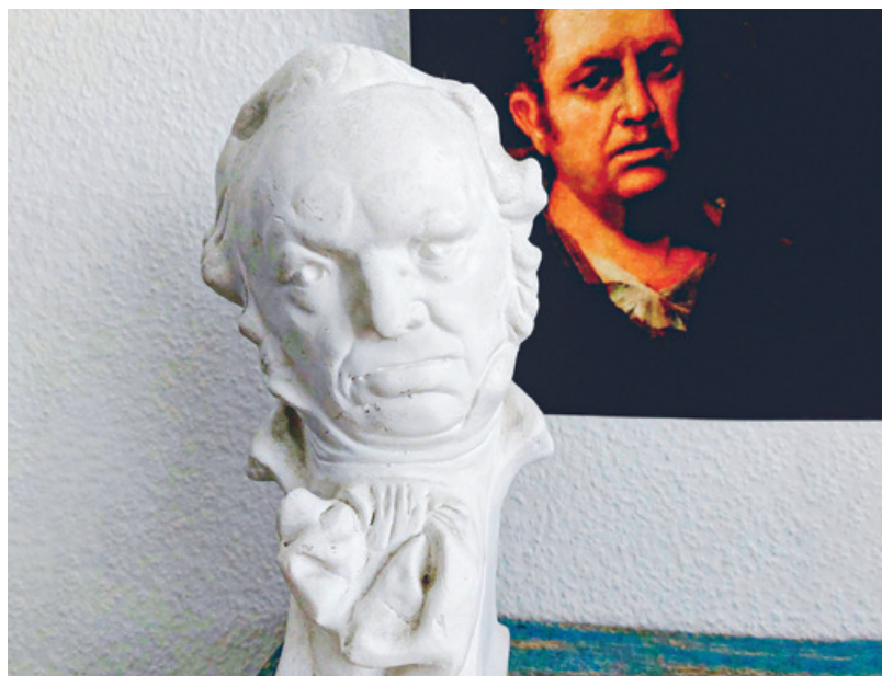
Büste von Francisco de Goya.