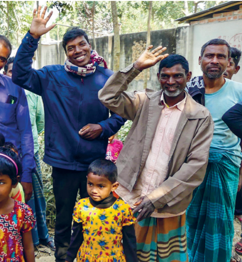
Adibashi Community bei Charagpur, Bangladesch.

gen, auf Ausbruch aus traditionellem Kastendenken, auf Ausbildung, auf Akzeptanz und auf gleiche Rechte wie die Mehrheitsgesellschaft.