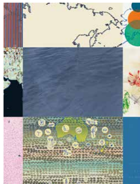
Neue Weltordnung.