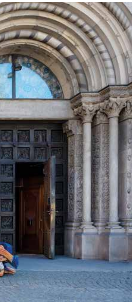
Polzskulpturen von geflüchteten Personen.