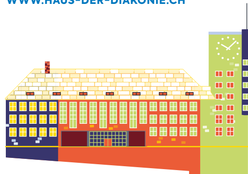
Leuchtturmprojekt: Haus der Diakonie.

INFORMATIONEN ZUM HAUS DER DIAKONIE UND DEN FOKUSGRUPPEN: WWW.HAUS-DER-DIAKONIE.CH