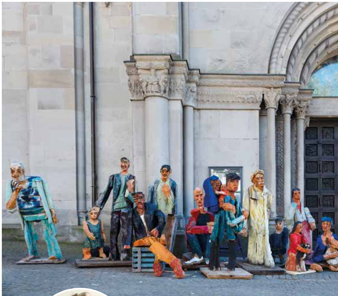
Die Ausstellung «entwurzelt & ausgeliefert» zeigt Menschen, die während des Zweiten Weltkriegs in der Schweiz Schutz suchten.